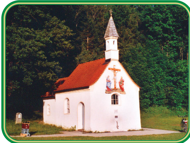
Das Frauenbründl mit seiner Heilquelle können Sie sogar zu Fuß von Weiterskirchen aus erreichen.

Bayerische Kultur rund um Weiterskirchen Zahlreiche Kirchen und Klöster laden zum Verweilen ein. Maria Altenburg, Tuntenhausen und Irschenberg sind nur einige der Sehenswürdigkeiten.