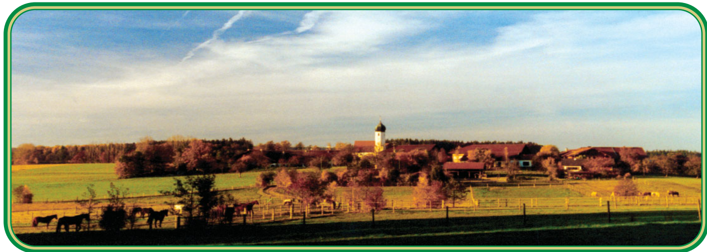
In Weiterskirchen finden Sie noch unberührte Natur. Das tut Pferd und Mensch richtig gut.