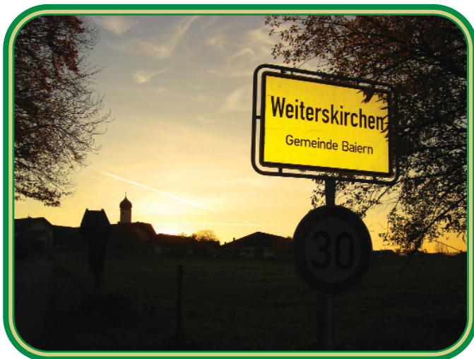
Weiterskirchen ist 30km östlich von München